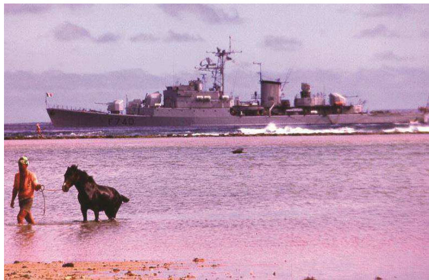
Polynésie - Rurutu