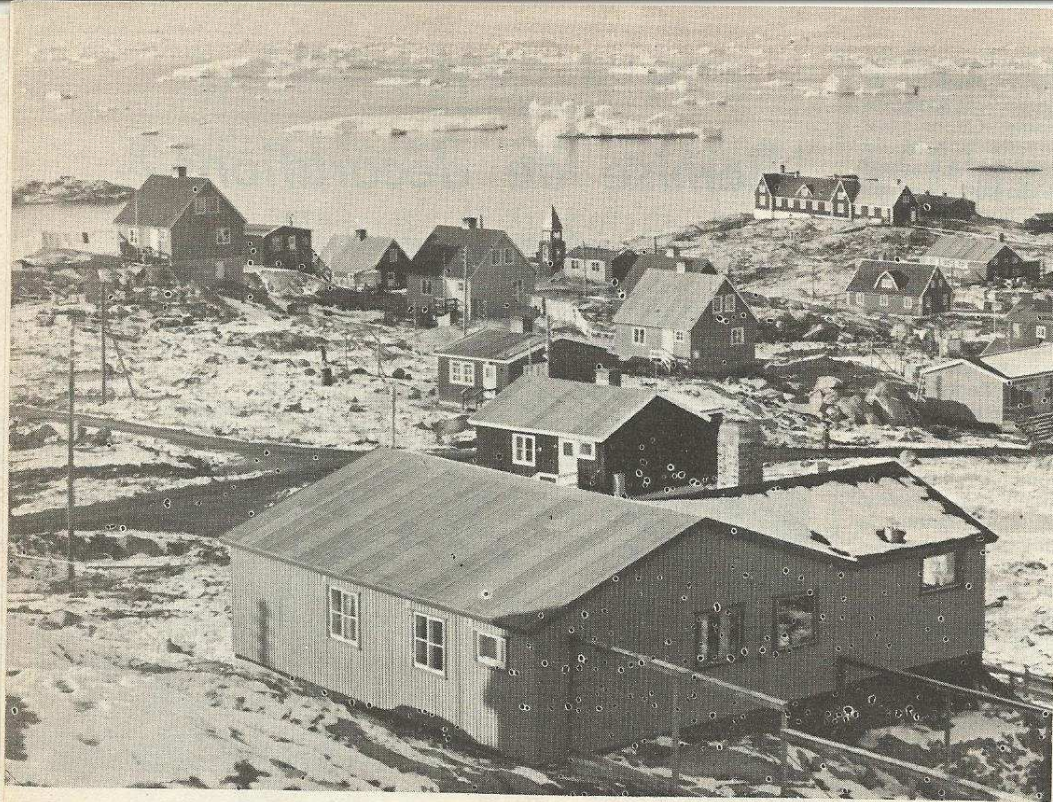
Une armada d'icebergs...