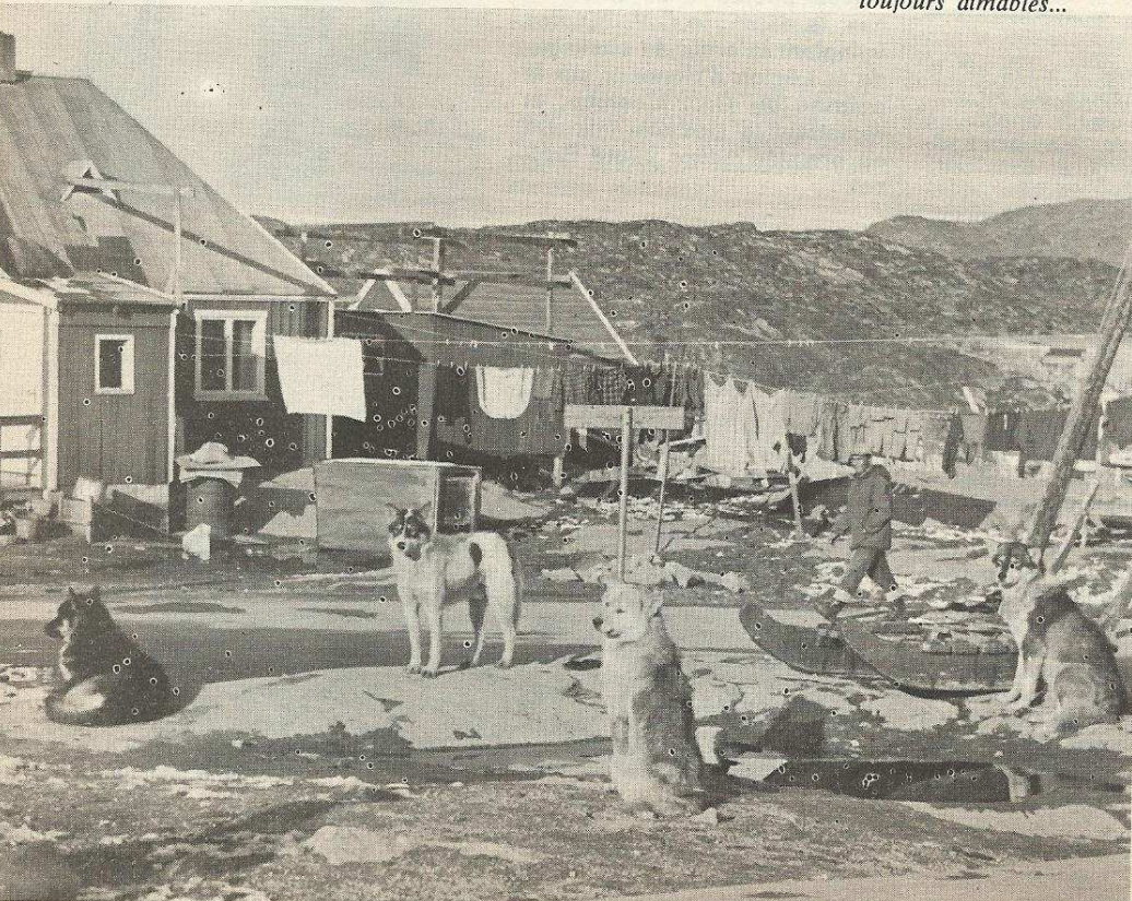
Ces chiens eskimos ne sont pas toujours aimables...

P OURSUIVANT ses errances hauturières et morutières ou plus prosaïquement sa campagne d'assistance à la grande pêche, le « Commandant - Bourdais » est remonté le long de la côte ouest du Groenland, à la rencontre des chalutiers français qui briquent les bancs groenlandais. Après deux brèves escales de ravitaillement à Godthab et à Holsteinborg, il a mouillé le 15 septembre à Jacobshavn, — 69° N latitude Nord. Située au fond de la baie de Disko, c'est une des agglomérations les plus boréales du Groenland.