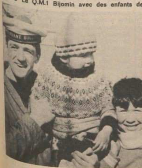
● Le Q.M.1 Bijomin avec des enfants de Godthaab. ● Mouillage à Ravn Stara.