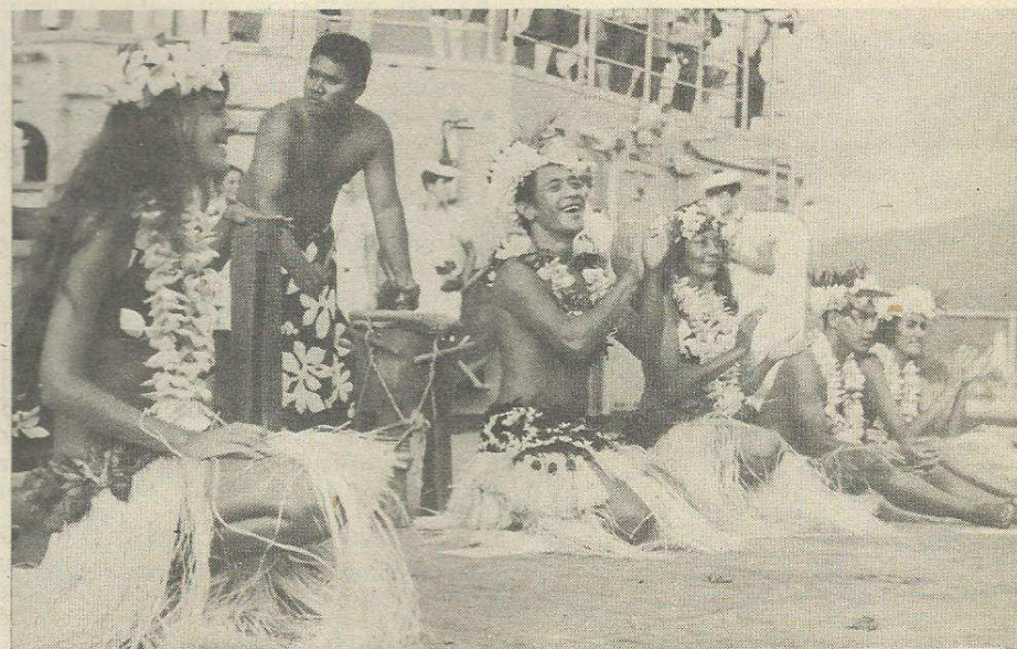
Papeete : image désormais traditionnelle.