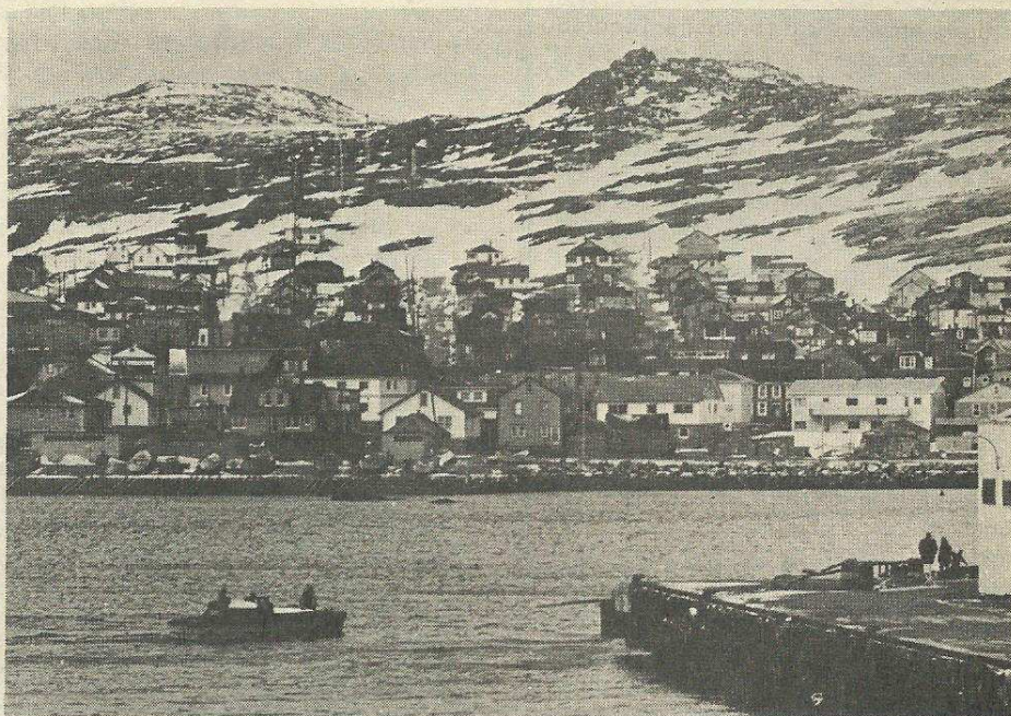
● Le quai des Doris. Port de St-Pierre.

Nous allons au devant des chalutiers qui pêchent parfois depuis deux mois sans la moindre escale : en bon saint Bernard nous proposons nos services : médecin, dentiste, courrier, pièces mécaniques, consommables, etc. C'est un travail imposant, tout le monde s'y met, certains font des prouesses et la