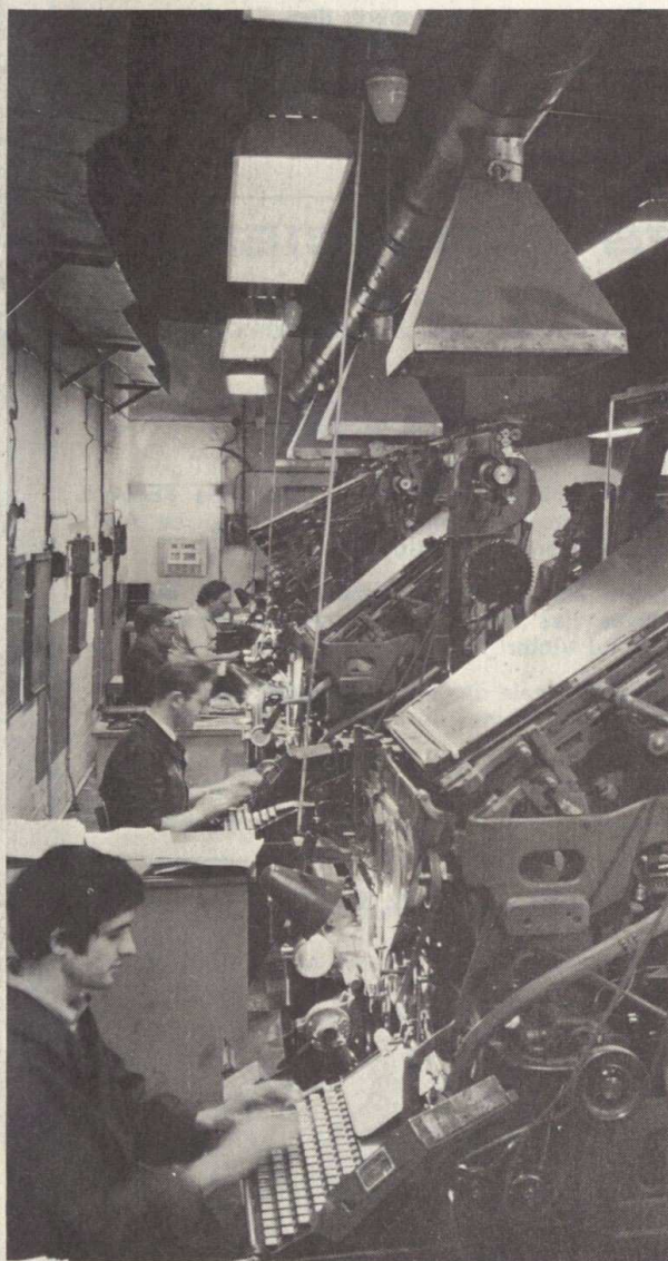
Houilles : imprimerie marine