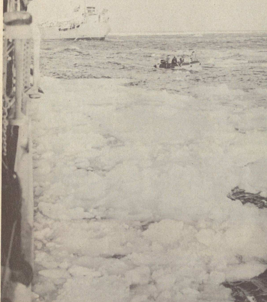
● Sous le vent du « Bourdais »

D EPUIS plus de deux mois le « Commandant Bourdais » ravitaille et assiste les chalutiers français de grande pêche. Arrivé en février, époque des brumes glacées, des ports terre-neuviens qui se figent en quelques heures, des nuits qui n'en finissent pas, le « Commandant Bourdais » fait des rotations entre les ports et les chalutiers.