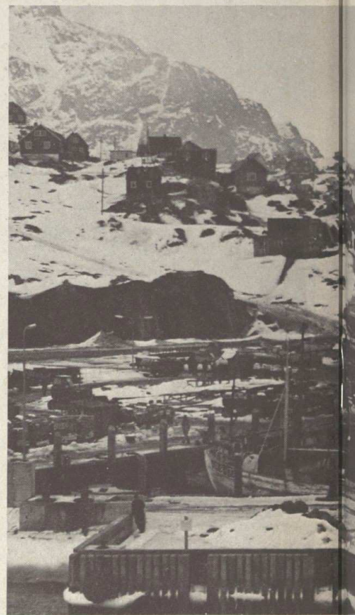
Holsteinborg (Groenland) : le port de pêche

De retour à Terre-Neuve, nous rendons aux pêcheurs le tribut de cette longue escale. C'est alors quinze jours de va et vient entre Saint-Pierre, Saint-Jean, le Golfe du Saint-Laurent et la banc du Bonnet Flaman. Nous sommes même amenés à faire le tour complet de Terre-Neuve par le détroit de Belle-Isle où nous rencontrons le premier iceberg de la campagne. Ce ne devait pas être le dernier. En effet, certains chalutiers sont allés tenter leur chance sur les bancs qui bordent la côte Ouest du Groenland où nous irons les assister quel-