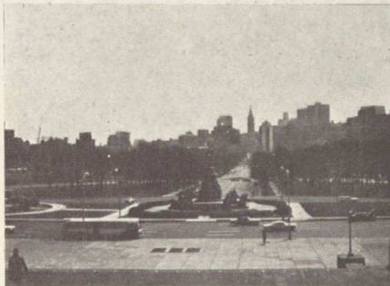
Philadelphie : City Hall vu de l'esplanade du Musée