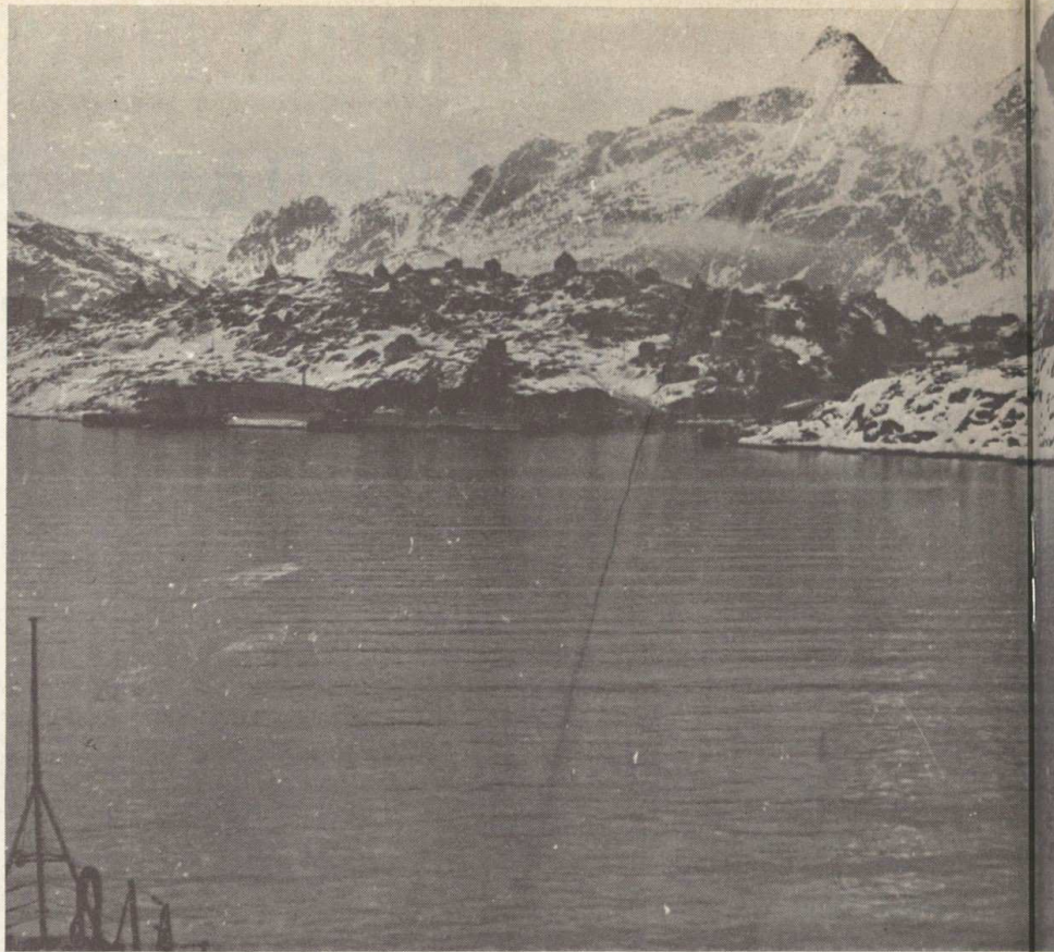
L'arrivée sur Holsteinborg

Le mardi 6, le « Bourdais » redescendait la rivière Delaware. Y eut-il une pointe de mélancolie et de regret ? Sans doute mais d'autres lieux l'attendaient.