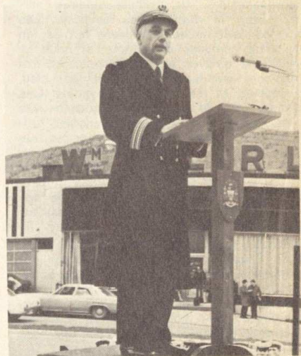
● Le discours du Commandant.

Pendant cet apéritif l'équipage est transporté dans les quartiers de la Canadian Legion, à Pleasantville. Il s'agit d'une ancienne base américaine. Pleasantville conserve sa facture américaine mais elle est actuellement occupée par l'armée canadienne. C'est un accueil très chaleureux que reçoivent les Français au son du « Pont de la rivière Kwaï ». On sympathise très vite, des petits groupes se forment, moitié canadiens, moitié français. Tout le monde chante, les hôtes apprécient beaucoup les vieilles chansons françaises comme « Alouette, gentille Alouette », puis plusieurs matelots se succèdent au piano, il y a une folle ambiance. Alors seulement on se hasarde au buffet. On goûte quelques mets aux couleurs étranges, propres à faire reculer les plus téméraires. Finalement les gens se regardent étonnés de trouver assez bonnes ces préparations que l'on avale en même temps que de nombreuses tasses de thé ou de café. La réunion se prolonge, on pose des tas de questions sur les us et coutumes de la Canadian Legion. Avant de partir chaque membre de l'équipage reçoit un souvenir, un cendrier aux armes de Saint-Jean.