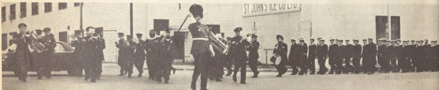
● Fanfare de la « Canadian Legion » en tête, une section du « Cdt Bourdais » traverse la ville.