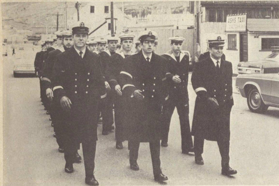
● La section du « Cdt Bourdais ».

qui nous font de grands gestes espiègles et enjoués. D'autres défilent à nos côtés en prenant des allures très martiales.