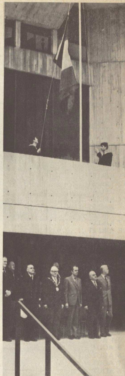
● Le pavillon tricolore est hissé au fronton de l'Hôtel-de-Ville.

La colonne Franco-Canadienne se met en branle, la musique en tête, quitte le port et s'avance dans les rues de la ville. Partout sur notre passage les gens sourient derrière leur vitrine ou se postent sur le pas de leur porte pour voir défiler les pompons rouges. Les enfants qui sont toujours friands de ces démonstrations nous suivent ou nous précèdent. Ils sont merveilleux ces petits garçons et petites filles, leur ice cream à la main,