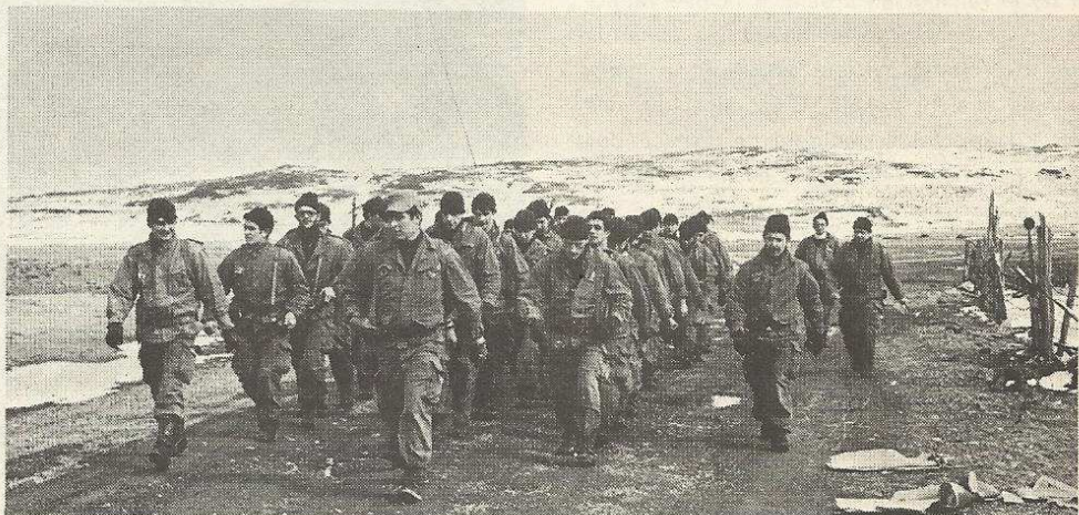
Débarquement sur l'île Miquelon