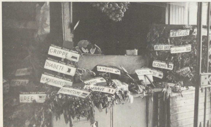
Une pharmacie un peu particulière.

L'équipage de l'A.E. Commandant Bourdais.