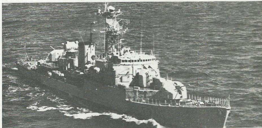
L'A.E. Commandant Bourdais.

A 14 h 34, le commandement des forces maritimes dans l'océan Indien était informé de cette demande. La position du navire lui était précisée par Brest, ainsi que sa vitesse et sa destination.