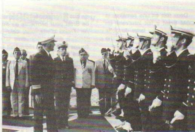
Les anciens de la 9 e DIC et du Bataillon de choc et les aspirants de l'Ecole navale.

Un hommage était rendu à bord aux victimes de l'opération sur l'île d'Elbe. Deux gerbes de fleurs étaient lancées à la mer