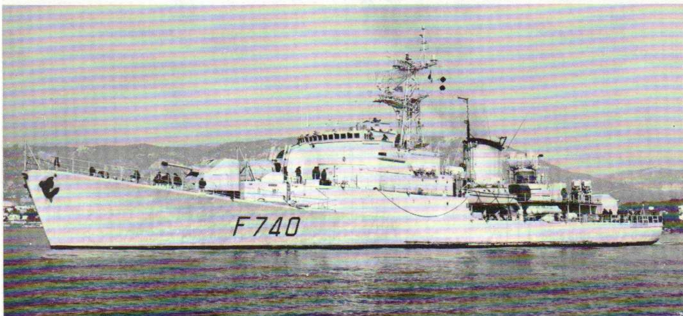
Commandant Bourdais.