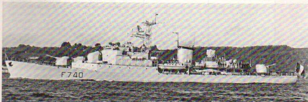
Le Commandant Bourdais.