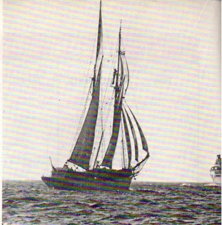
Cap au large.