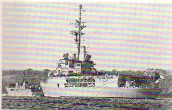
La Jeanne d'Arc.

Au premier rang de l'assistance, on remarquait treize jeunes officiers stagiaires étrangers, venant de pays très divers : Maroc, Tunisie, Algérie, Sénégal, Zaïre, Gabon, Egypte, Thaïlande, Madagascar et Mauritanie. « Votre présence en est pour moi le meilleur gage, ajouta le ministre de la Défense, qui insista à nouveau