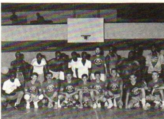
Les équipes de basket de la Jeanne et des Coast Guards.