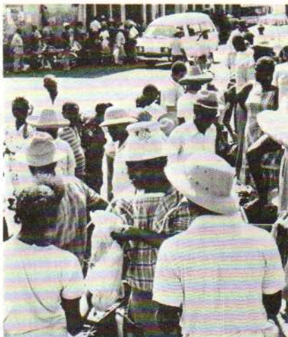
Marché de Fort-de-France.

E.V. 2 Stoupak et les officiers-élèves du poste 15