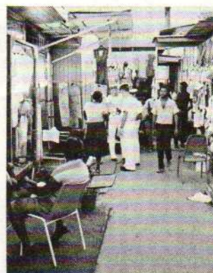
A Port d'Espagne.