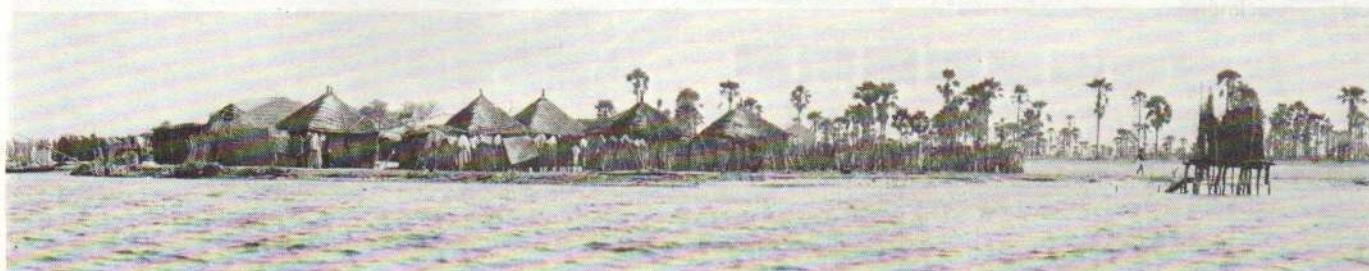
Kayar, village de pêcheurs.