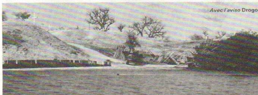
Sur une île de coquillages : le cimetière.