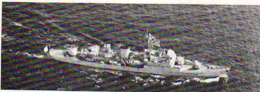
Le Doudart de Lagrée.