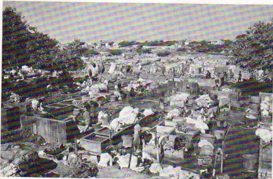
Dans les faubourgs de Karachi.