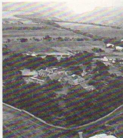
Le domaine de Longwood.