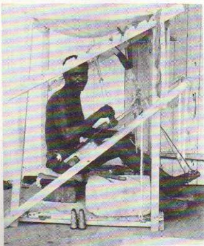
Un tisserand à son atelier.

imaginé, est dépassé par la réalité, si variée et si fascinante. Vous croyez découvrir un pays, un peuple, vous vous retrouvez face à une multitude de climats et de végétations, à une infinie variété de groupes et de tribus aux dialectes parfois différents et à autant de traditions et de coutumes.