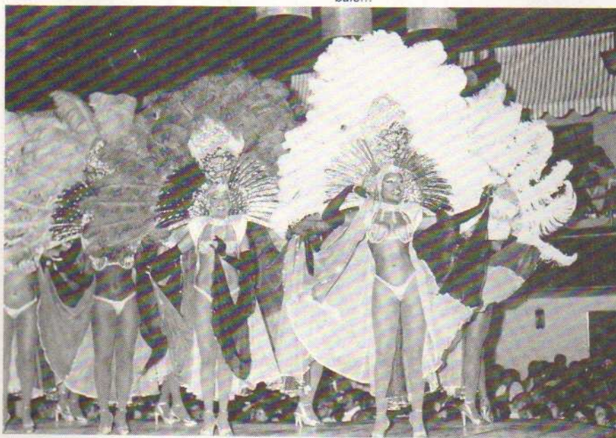
... ces superbes créatures que sont les danseuses de Samba.