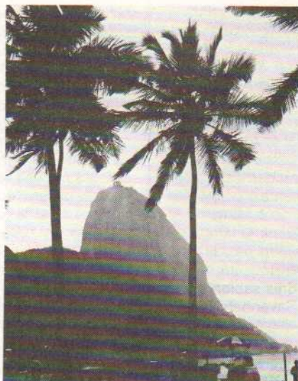
Le Pain de Sucre, gardien fidèle à l'entrée de la baie...