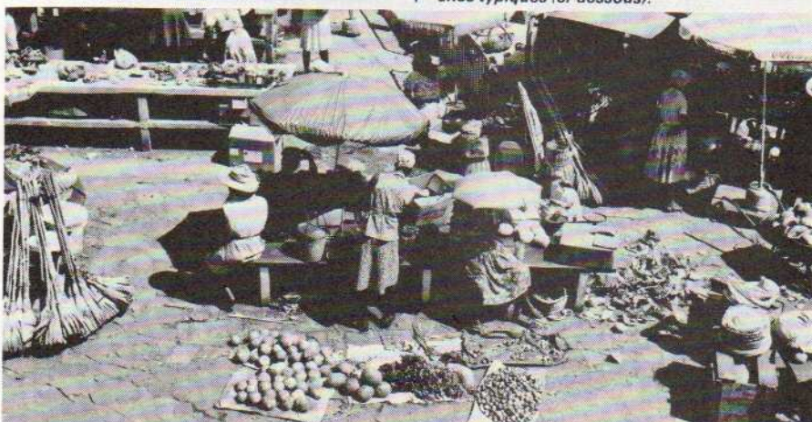
... que l'on retrouve notamment dans ses marchés typiques (ci-dessous).