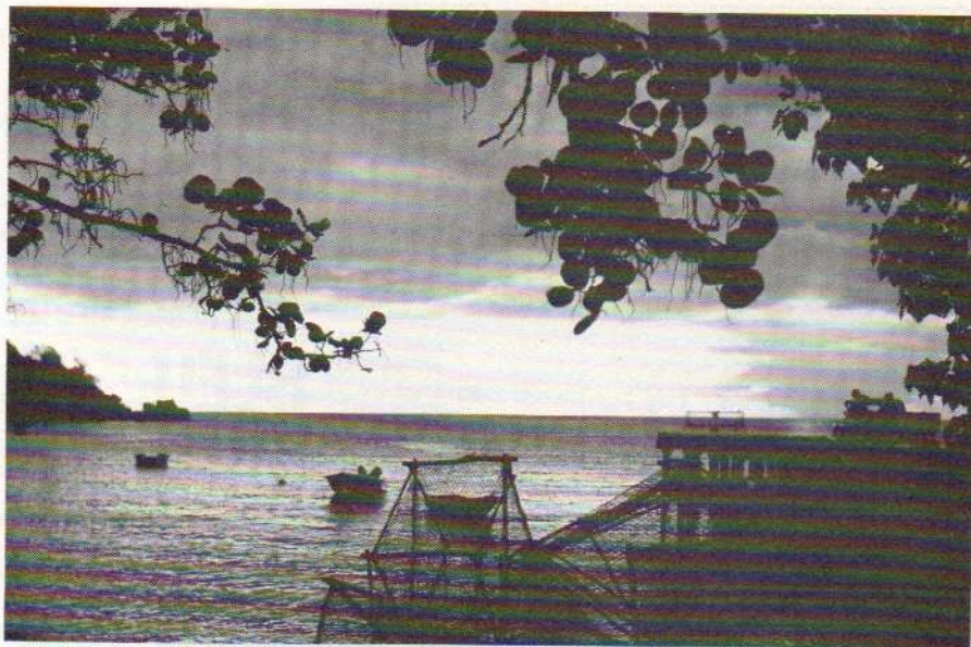
« Là, tout n'est qu'ordre et beauté, luxe, calme et volupté » (Charles Baudelaire).

Le sport est à l'honneur à Pointe-à-Pitre où de nombreuses rencontres sont organisées et, de même, réceptions et manifestations officielles : soirée au Club Méditerranée, banquet de l'AM-