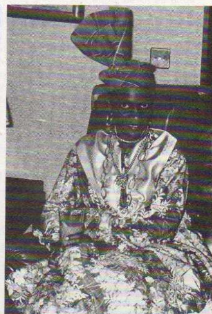
Ci-dessus, Guadeloupéenne toute de séduction et d'élégance, parée de sa toilette la plus somptueuse.