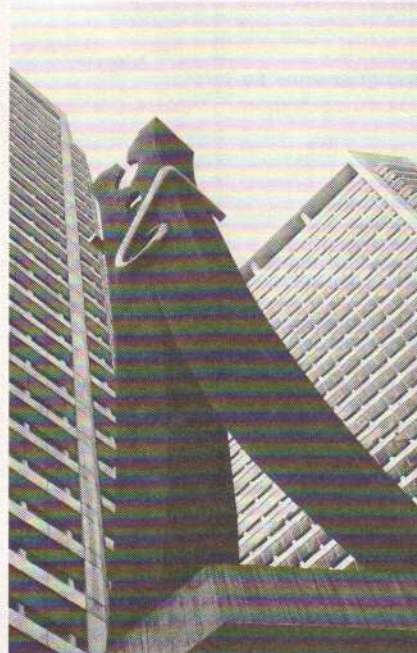
Aux Etats-Unis, même un objet utilitaire peut être source d'inspiration artistique.