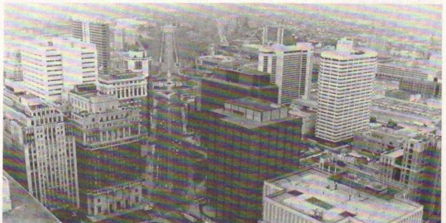
Le centre de Philadelphie.

Research Institute » et l'Université navale de Bethesda qui forme leurs homologues de l'armée américaine.