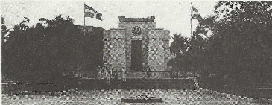
Le monument de l'indépendance.

Louverture fit accéder l'île à l'indépendance à la faveur des troubles de la Révolution française. Cette indépendance ne fut finalement acquise qu'après un second protectorat espagnol qui laissa l'île scindée en deux Etats : Haïti et Saint-Domingue.