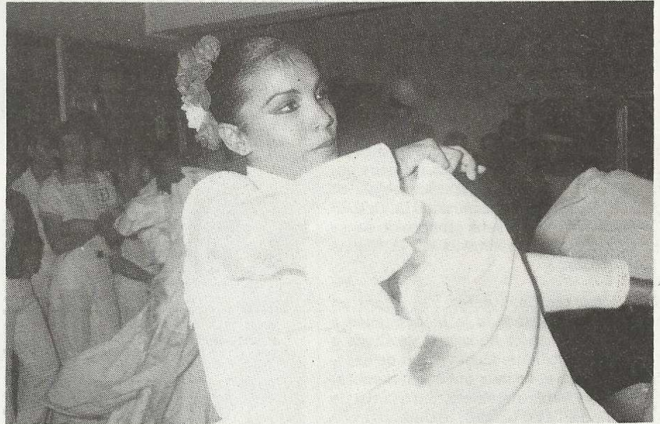
Candeur des îles et fierté andalouse : un mélange réussi.