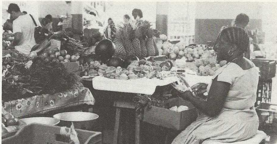
Le marché à Pointe-à-Pitre.