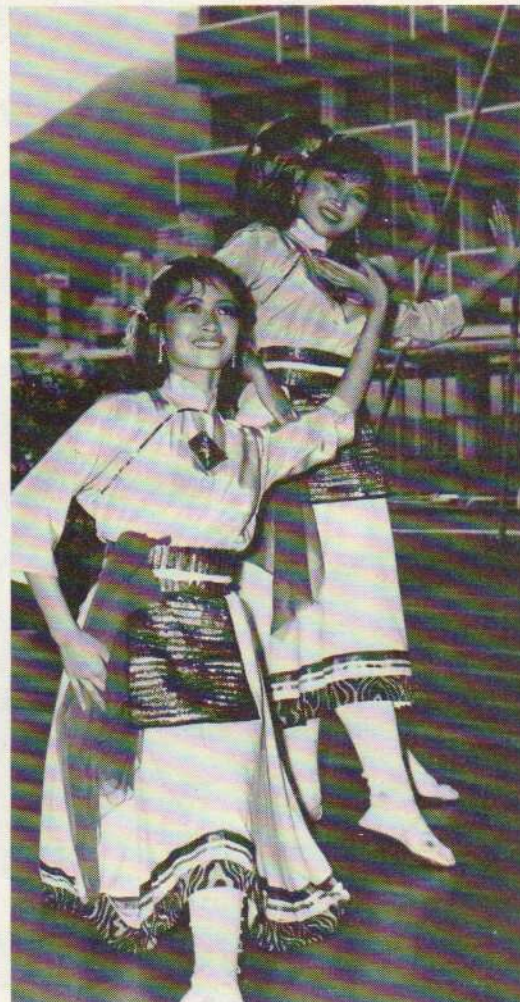
Charmante visite à bord de la Jeanne d'Arc

La Jeanne s'éloigne du quai ; au loin la ville s'éveille. Ferries et jonques vont et viennent inlassablement. Les cheminées des usines fument. A Hong-Kong la vie ne s'arrête jamais, pas même pour un départ de la Jeanne d'Arc .