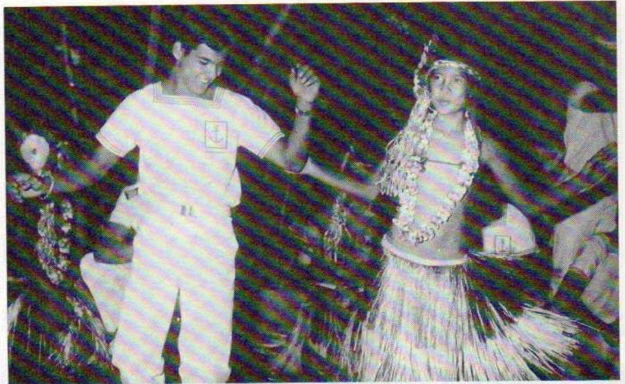
Soirée folklorique à Nouméa