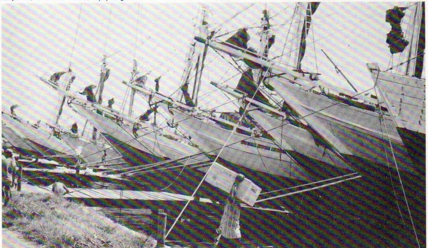
Les prahus, voiliers traditionnels du pays Bugi.