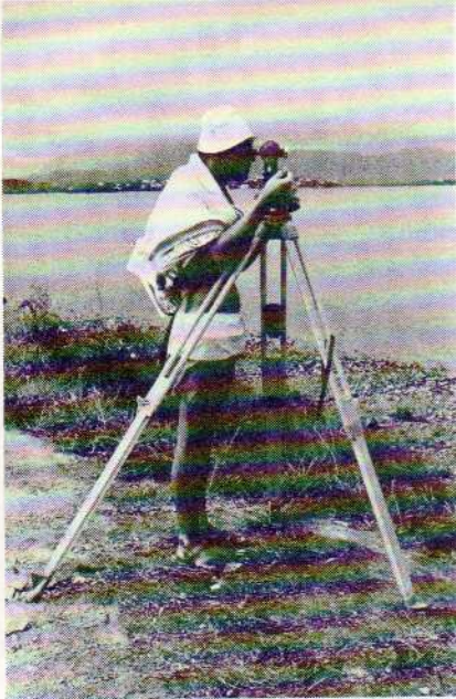
Stage d'hydrographie en baie de Sainte-Marie