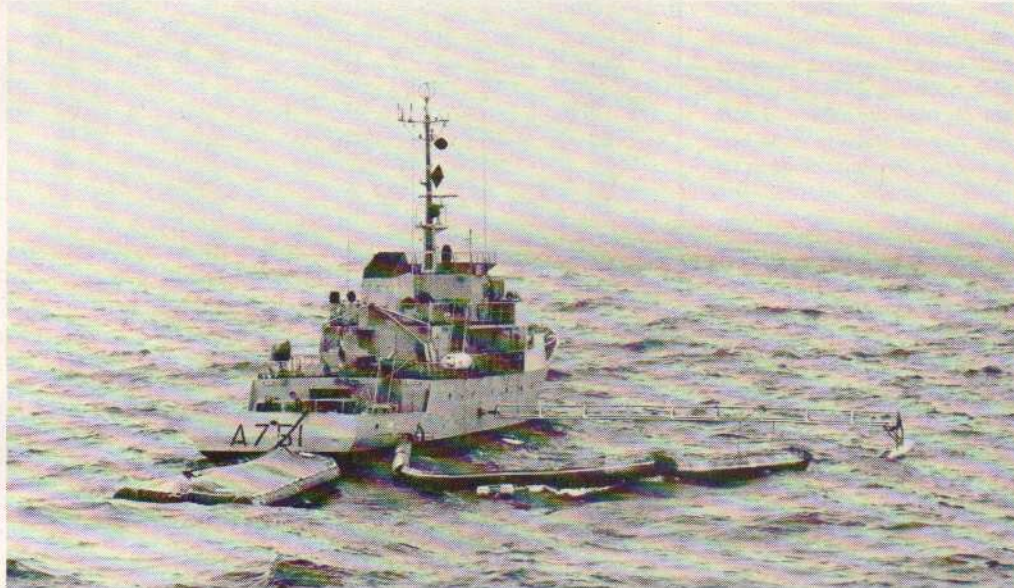
Le bâtiment école Lynx et son récupérateur Sirène