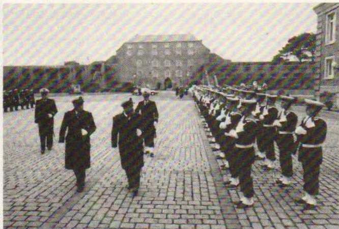
L'amiral Louzeau passe les troupes en revue

L'amiral Louzeau, chef d'état-major de la marine, s'est rendu à Brest le mercredi 4 février pour prendre contact avec les forces maritimes. Il a été accueilli à son arrivée par le V.A.E. Corbier, préfet maritime de la deuxième région et commandant en chef pour l'Atlantique. Les honneurs ont été rendus dans la cour de la préfecture maritime par une compagnie du Groupement de fusiliers marins et la Musique des équipages de la Flotte de Brest au grand complet.