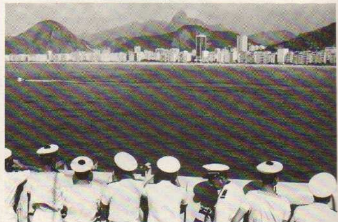
Comme les marins d'autrefois annonçant émerveillés : « Terre »

Le funiculaire du Corcovado et le téléphérique du Pain de sucre voient au cours des six jours