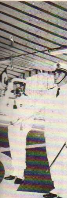
Le ministre des Affaires étrangères M. Jean-Bernard Raimond, en visite officielle au Brésil, a été accueilli à bord de la Jeanne d'Arc

Quatre pollutants ont participé à l'exercice ainsi que le bâtiment de soutien de région Elan qui a acheminé sur zone des produits dispersants et coagulants nécessaires au traitement d'éventuelles pollutions ainsi qu'un chalut pour récupérer en surface les produits agglomérés.