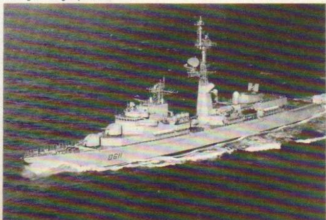
La frégate Duguay Trouin