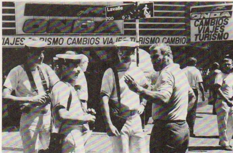
Dans les rues de Buenos Aires

retrouverons en Uruguay, où se rendent chaque été de nombreux habitants de Buenos Aires attirés par les immenses plages de sable fin de Punta del Este.