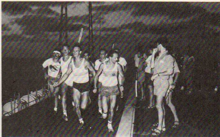
Les quatre heures du rio de Plata

Les privilégiés qui, entre temps, ont pu pousser leur découverte de l'Argentine jusqu'à Iguazu nous racontent le spectacle majestueux et splendide des chutes. Cette escale inoubliable aura vu pour la première fois cette année plus de huit mille visiteurs à bord. Amassés sur le quai au moment du départ, ils sont des centaines à venir nous dire au revoir, et certains pour une journée, car nous les