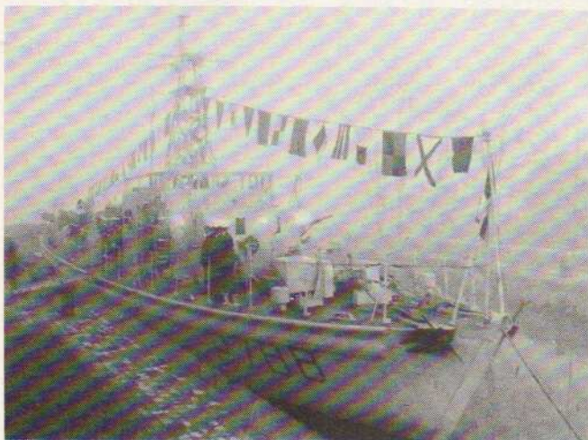
Le patrouilleur maritime Violette

La Violette , dernier patrouilleur maritime de Rochefort, a quitté définitivement son port d'attache pour rallier Lorient et y être désarmée.