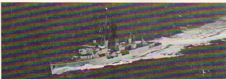
Le Du Chayla

Propos d'accueil des élèves de l'école de Yoff.