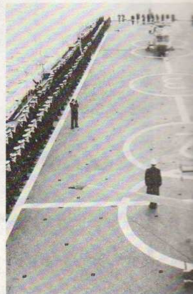
Cérémonies dans le détroit des Dardanelles

Le désir de rencontrer les Stambouliotes nous conduit