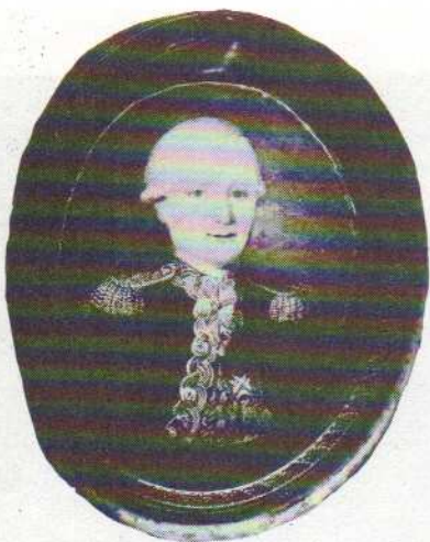
Le C. V. Fleuriot de Langle (collection privée)

La Pérouse commandait la Boussole , le vicomte de Langle, son second, commandait l' Astrolabe . C'est sous les ordres de ce dernier qu'une corvée partit vers la plage pour faire de l'eau.