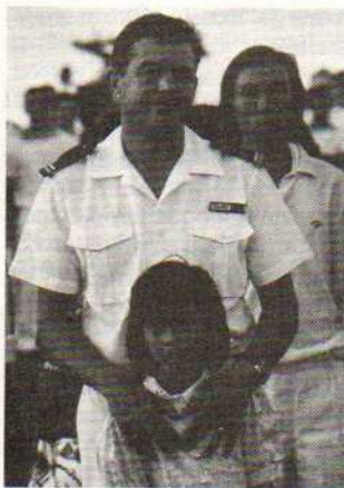
A bord de la Jeanne d'Arc.

Le lendemain, nous rencontrons un pêcheur vietnamien. Un jeune homme essaie de choisir la liberté et saute sur notre dinghy. Le patron du pêcheur saute à