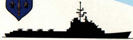
P.H. "JEANNE D'ARC"