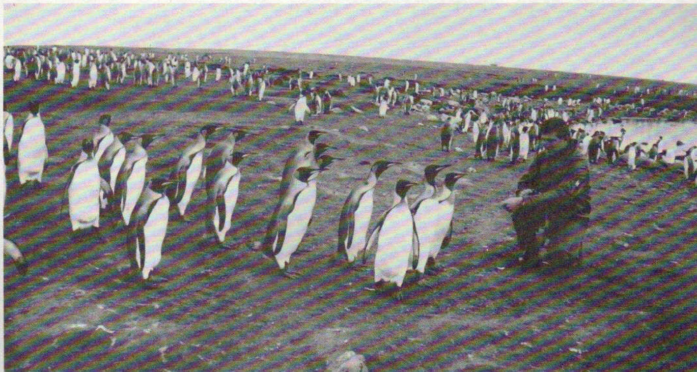
Un pingouin devant des manchots (EV2 (S) Laignel, pilote d'hélicoptère).

l'hélicoptère qui a transporté nos explorateurs en reconnaissance à l'ouest de l'île, jusqu'au magnifique glacier Cook.