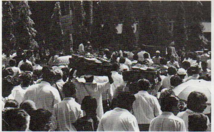
...d'incroyables chargements de gamelles en fer blanc.

Les trains ralentissent puis s'arrêtent avec douceur. Arrivant par vagues successives, ils déversent leurs marées humaines sur le quai. La foule entraîne tout sur son passage ; gare au malheureux qui essaie de remonter ce flux à contre-courant ! Marins perdus dans cette foule, nous assistons à un défilé continu de saris multicolores. Le carmin côtoie le turquoise, le safran s'associe au parme, l'or se fond dans les fibres des tissus. L'air