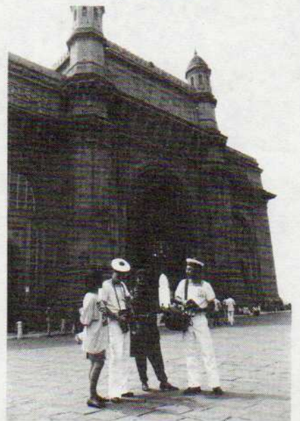
La « porte de l'Inde ».

Plusieurs marins, intrigués, décident d'emboîter le pas à l'un d'eux et de le suivre. D'un pas ferme, énergique et décidé, il navigue avec sa précieuse cargaison parmi la foule jusqu'à Indira Dock où la Jeanne d'Arc , le Commandant Bourdais et le Commandant Bory sont accostés. La sonnerie de la soupe retentit à bord des bâtiments. Sur le quai, les dockers, servis en un clin d'œil, s'éparpillent. Ils se juchent sur des montagnes de céréales en sacs et savourent le tandori familial avec force commentaires. La pause déjeuner est brève ; les boîtes, récurées, sont rapidement rangées et reprennent à grandes enjambées le chemin de la gare. ■