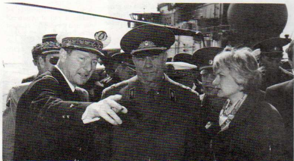
Le général Yazov lors de sa visite sur le Clemenceau .