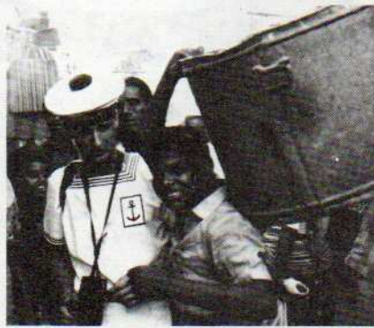
... bien entouré...

devient irrespirable, l'odeur des épices se mêle subtilement aux parfums des femmes. Lorsque leurs cheveux ne s'ornent pas de fleurs, elles supportent de larges corbeilles d'osier contenant linge et nourriture. Certaines, plus assurées, se précipitent vers la sortie évitant ainsi le tumulte inéluctable de chaque arrivée. Cris, bavardages incessants, diffusions continues annonçant les trains de banlieue limitent toute conversation cohérente.