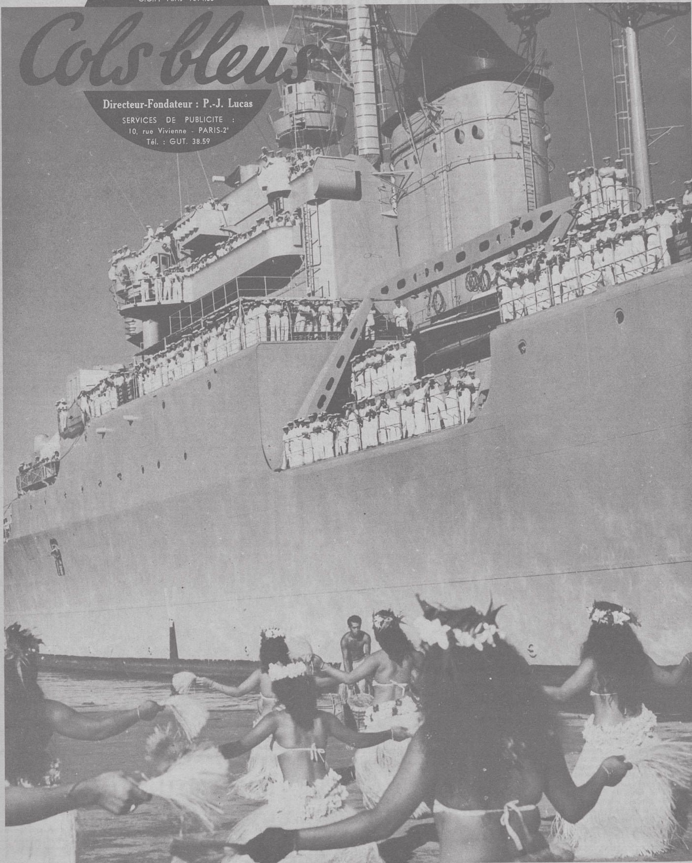
Le « DE GRASSE » à Papeete : accueil dansant et fleuri

SERVICES DE PUBLICITE : 10, rue Vivienne - PARIS-2 e Tél. : GUT. 38.59