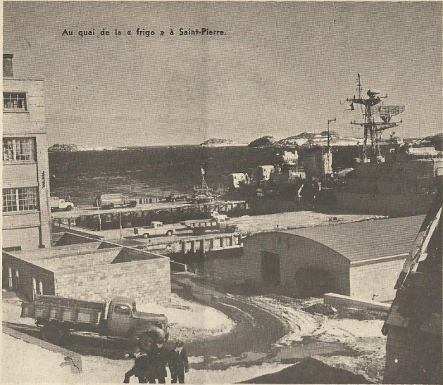
Au quai de la « frigo » à Saint-Pierre.