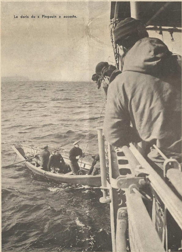
Le doris du « Pingouin » accoste.

A PRES quelques jours d'escale à Saint-Pierre-et-Miquelon, le « Commandant-Bourdaï » appareille pour une nouvelle tournée sur les bancs de Terre-Neuve afin d'y assumer sa mission d'assistance aux chalutiers.