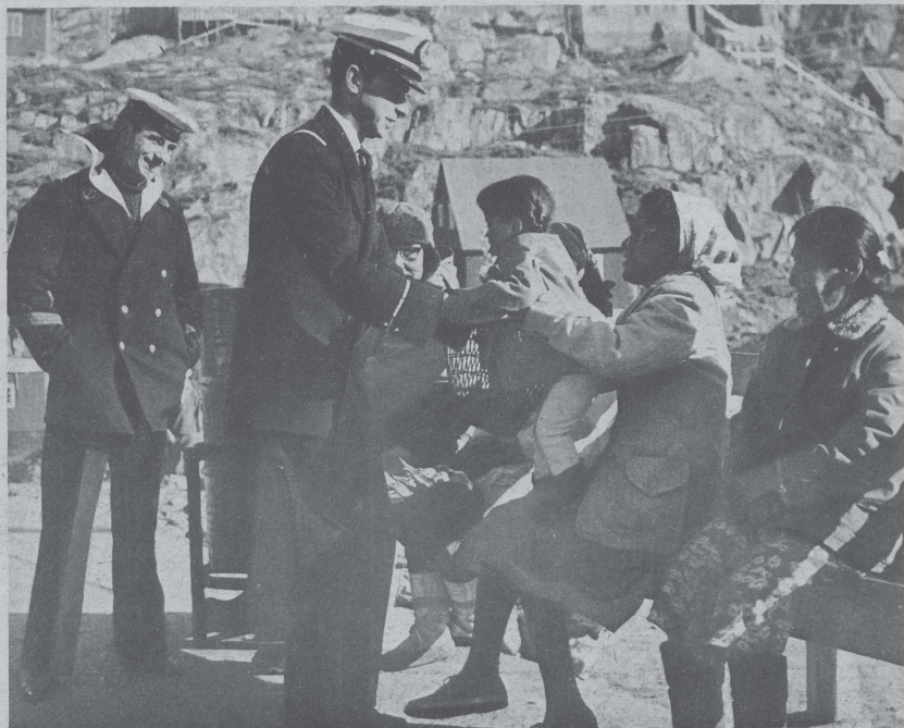
Escale de routine à Holsteinborg : entretien amical avec une famille Esquimaue. L'O.R.I.C. Bourdaï et le quartier-maître Maréchal.