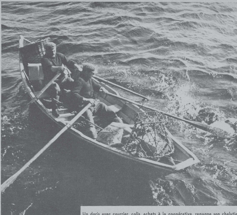
Un doris avec courrier, colis, achats à la coopérative, regagne son chalutier.