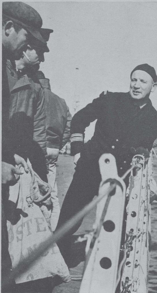
Le C.F. Desmants converse avec le marin d'un chalutier.

C OMME on sait, du 1 er au 15 avril, l'avis-escorteur Commandant Bourdais a effectué la première patrouille de sa campagne 1965 sur les bancs de Terre-Neuve.