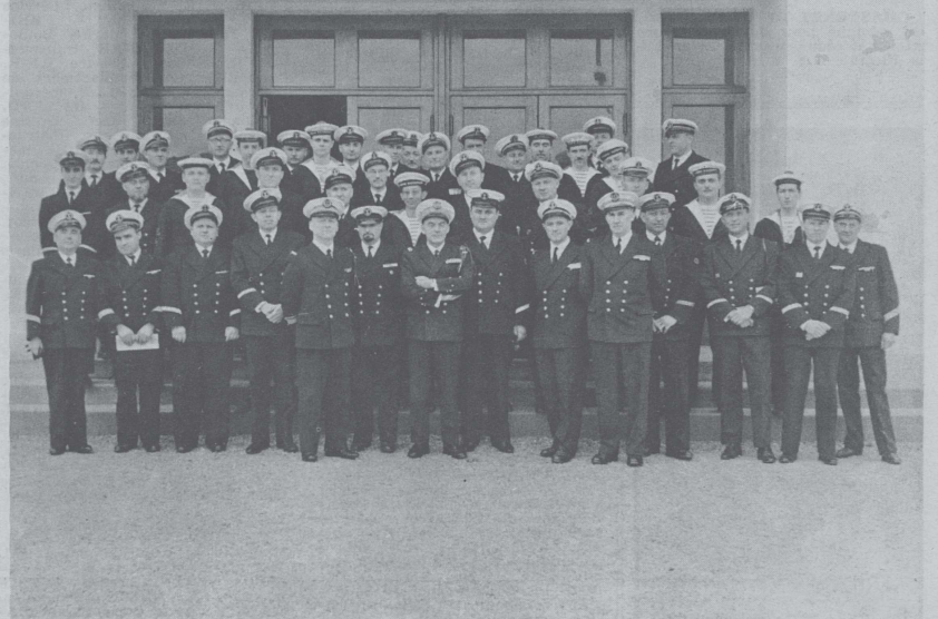
Des journées d'instruction des personnels de réserve non-officiers ont eu lieu à Lorient les 22 et 23 mai comme nous l'avons annoncé dans notre dernier numéro. Voici une photo des participants.