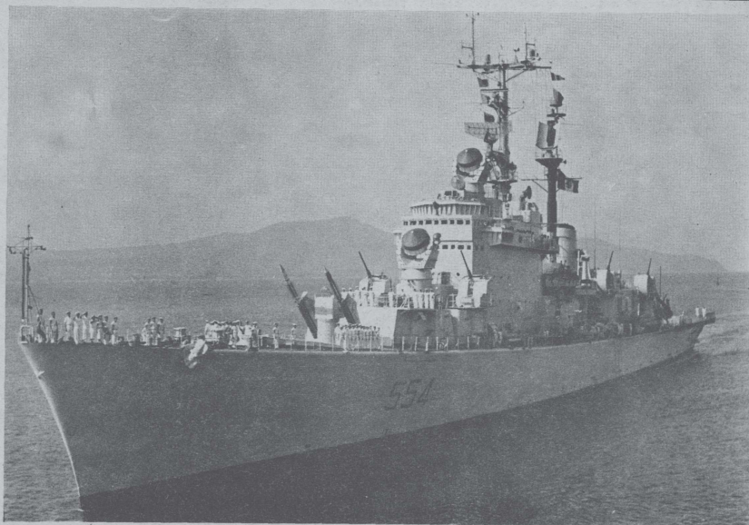
Le croiseur « Caio Duilio ».