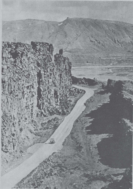
Paysage islandais : arrivée à Thingvellir.

APRÈS avoir quitté les eaux du Groenland pour rejoindre le Norvège, le Commandant-Bourdais a emprunté en sens inverse les routes suivies il y a de nombreux siècles par les premiers navigateurs qui, partis d'Europe, s'étaient dirigés vers l'ouest à la recherche de terres nouvelles : du moins irlandais saint Brendan aux Vikings, poussés par les vents d'Est, tous ont navigué des côtes européennes du Nord vers les Féroé, puis vers l'Islande et au-delà à travers le détroit de Danemark vers le Groenland.