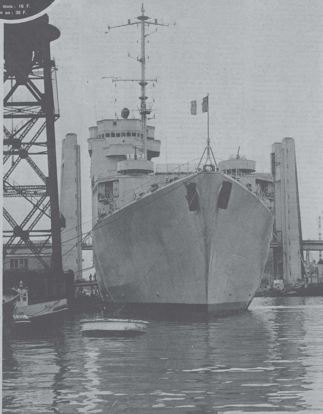
Revenant du Pacifique, le TCD « Ouragan » est arrivé à Brest (page 10)