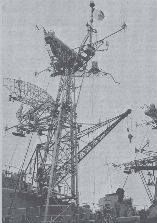
Superstructures de l'A.E. « E.V. Henry ».

Le dimanche 5 septembre, à 8 heures, l'A. E. « E. V. Henry » entrain en rade de Saint-Jean-de-Luz y retrouvant les frégates anglaise « Esmouth » et espagnole « Legazpi » déjà mouillées depuis quelques jours.