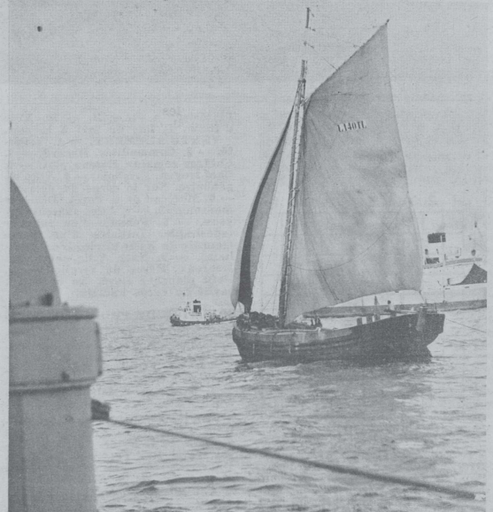
Rencontre sur le Tage.