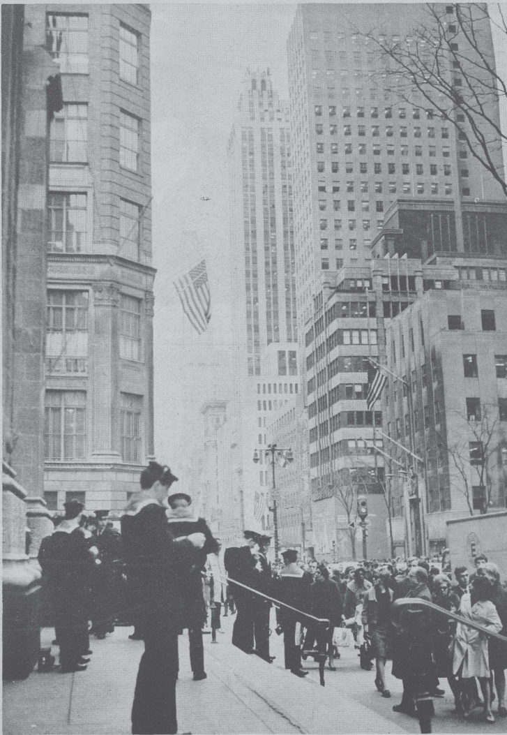
Dans les rues de New York, la curiosité est réciproque...