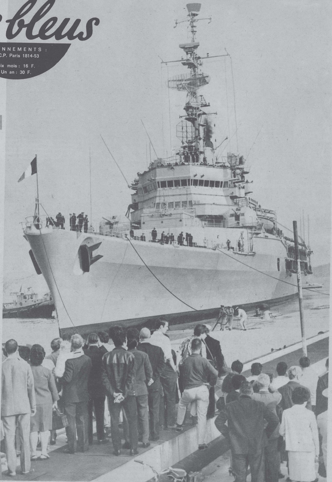
16 mai : la « Jeanne-d'Arc » accoste aux appontements de Milhaud, où attendent les familles...