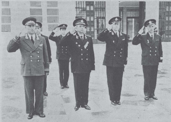
Visite à la Préfecture maritime.

— 32 officiers. — 276 officiers - mariners, quartiers-maitres et matelots + une musique de bord de 25 exécutants.