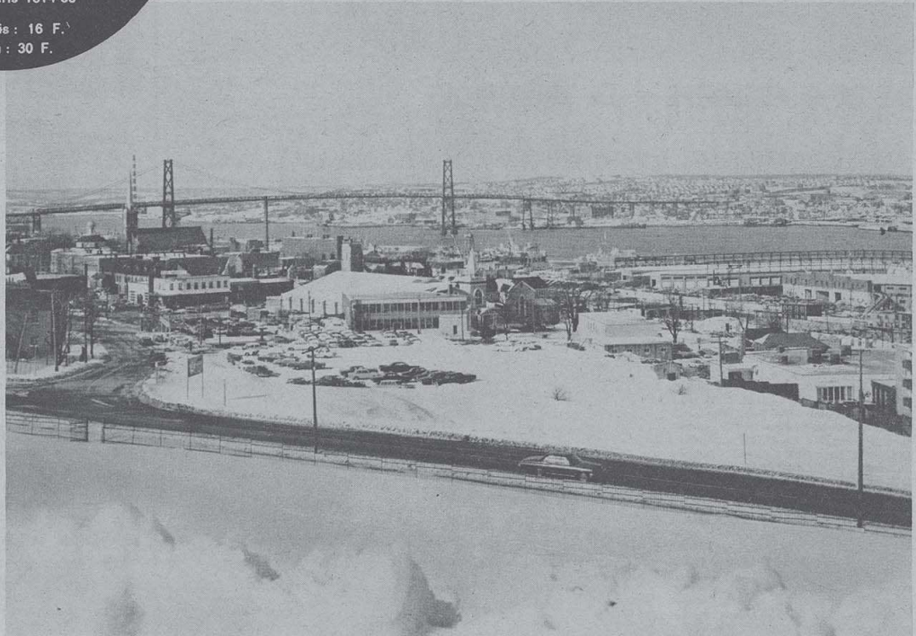
Le « Commandant-Bourdais » au Canada : Halifax et le pont Mac-Donald. Au-dessous : poste de manœuvre dans la neige.